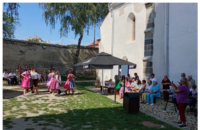
Reps Tag der Offenen Tür